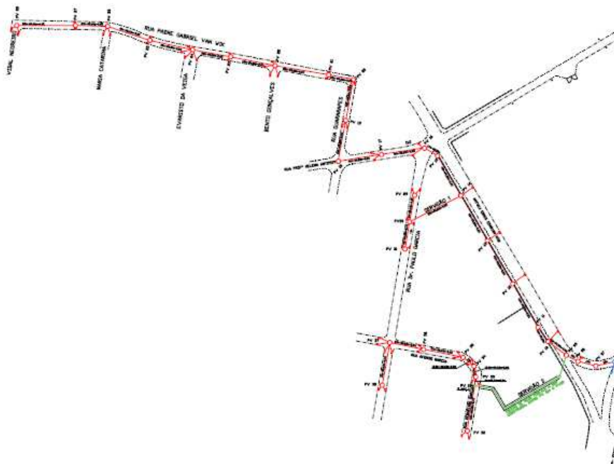
Figura 4: Identificação do trecho 2, demarcado em vermelho.

A rede de drenagem, objeto do presente projeto, lançará, a jusante, em rede existente na rua Garcia Rodrigues Paes (trecho 4), após transposição de linha férrea por Tunnel Liner a ser executada pela MRS Logística (trecho 3).