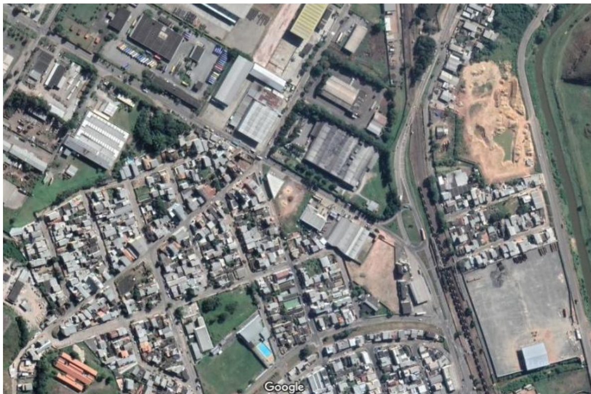
Figura 1: Identificação do local objeto do projeto. Google, 2021.

O município de Juiz de Fora vem, através desse relatório, apresentar o projeto para intervenções estruturais e não estruturais voltadas a redução das enchentes, inundações e melhorias das condições sanitárias, patrimonial e ambiental das ruas Padre Gabriel Van Wik, trecho das ruas Paulo Garcia, Sebastião Garcia, Afonso Garcia, Antônio Simão Firjan e Avenida Juscelino Kubitschek.